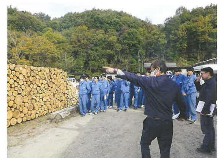
木材センターの見学