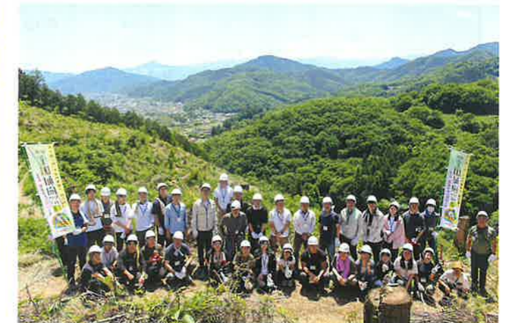
大勢の職員にご参加いただきました